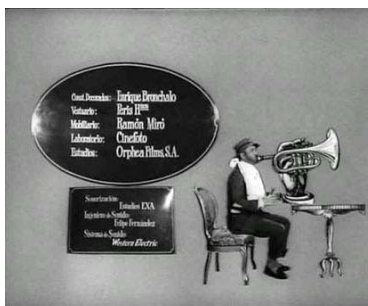
Estamos de fiesta...