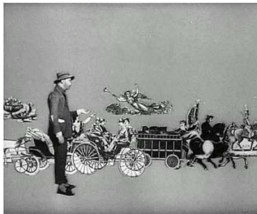
Viendo pasar los placeres de la vida.