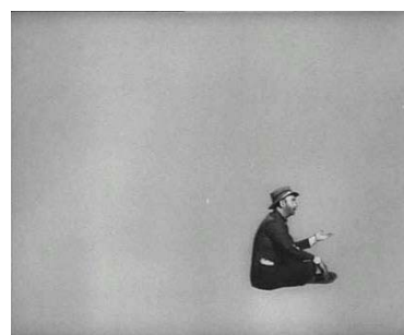
... y de nuevo en la calle.