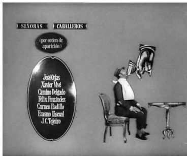
Y termine con champán.