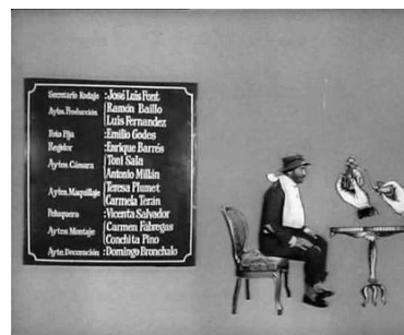
... ni de perfumarlo.