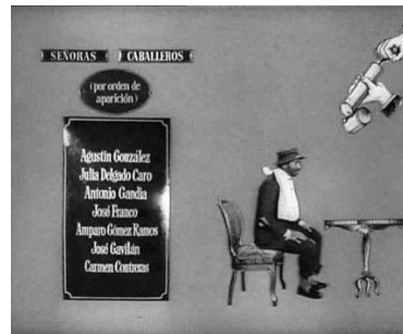
No se olvide de desinfectarlo...