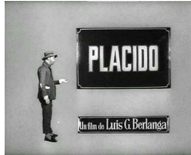
Una limosna por favor.