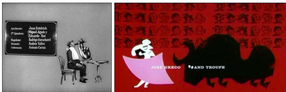
A la izquierda, “Plácido”. A la derecha, “La vuelta al mundo en ochenta días”.

Indudablemente con este filme, realizado en 1956, se pueden emparentar los títulos de crédito de Plácido , que García Berlanga haría muy pocos años después, en 1961.