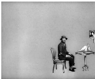
Dele de comer...