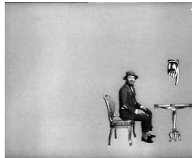
Siente un pobre a su mesa.