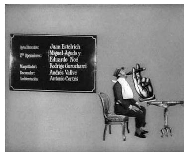
... no estorba un buen habano...