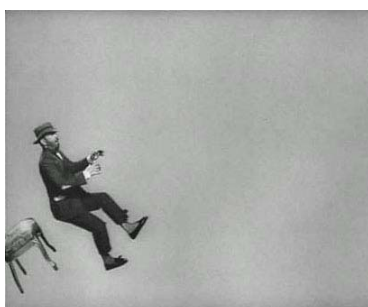
... pero todo acaba...