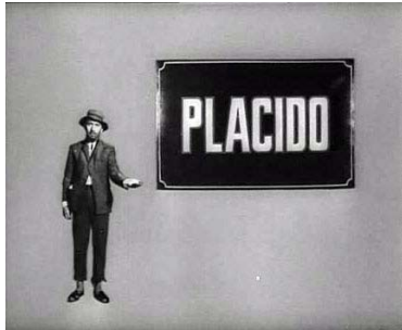
Pobre de solemnidad.

Para ilustrar nuestras reflexiones creemos que una posible síntesis de estos títulos de crédito podría ser la siguiente selección de algunos de sus fotogramas por orden de aparición. Igualmente con los comentarios con que los acompañamos pretendemos resumir su contenido.