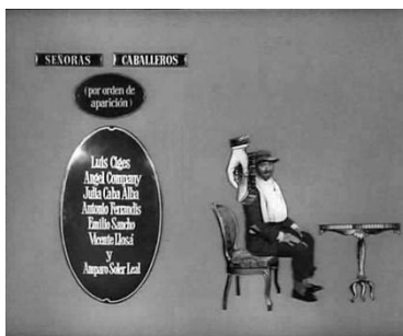
... ni de cepillarlo...