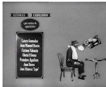
... y de beber...